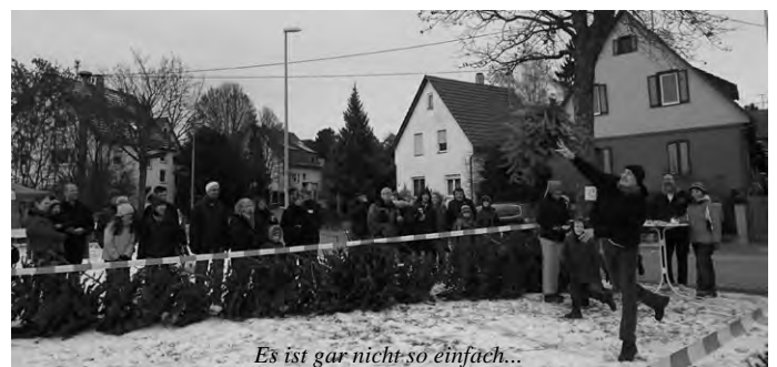
Es ist gar nicht so einfach...