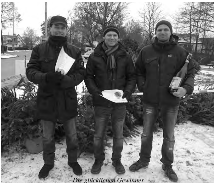
Die glücklichen Gewinner

Als 1. Preis war eine 3-l-Flasche Bier ausgelobt worden, als 2. und 3. Preis jeweils ein Gutschein für den Kauf eines neuen Weihnachtsbaumes bei Peter und Paul im Dezember 2017. Wäre ein Besucher so mutig gewesen, im Schottenrock zu erscheinen, so wäre auch dies mit einem kleinen Preis honoriert worden. Es war wahrscheinlich aber zu kalt, sodass sich die Weitwerfer lieber gut eingepackt hatten. Der Musikverein Ötlingen hatte sich als neue Attraktion das Weitwerfen des Weihnachtsbaums überlegt, weil die Veranstaltung eines Funkenfeuers in diesem Jahr nicht mehr möglich war, da kein geeigneter Platz dafür gefunden werden konnte. Während der Veranstaltung konnten sich alle Besucher mit Glühwein bzw. Kinderpunsch und Roter Wurst aufwärmen.